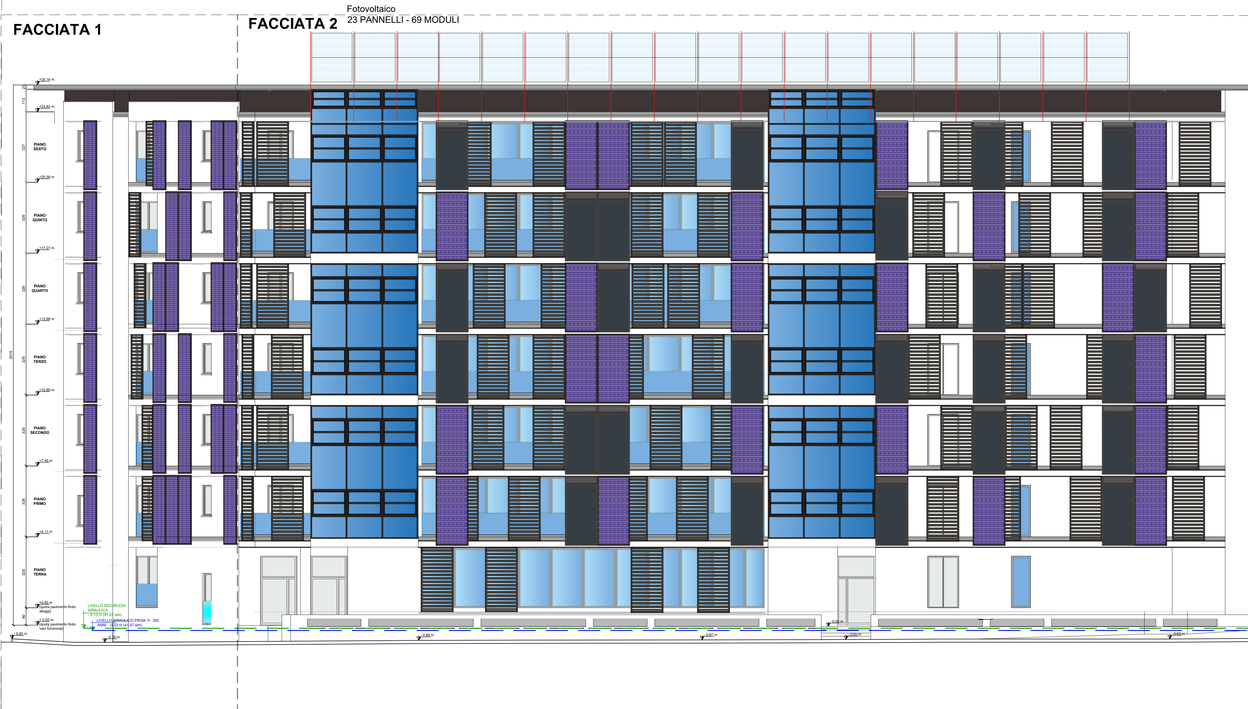
Prospetto Sud-Est - Blocchi 1 e 2